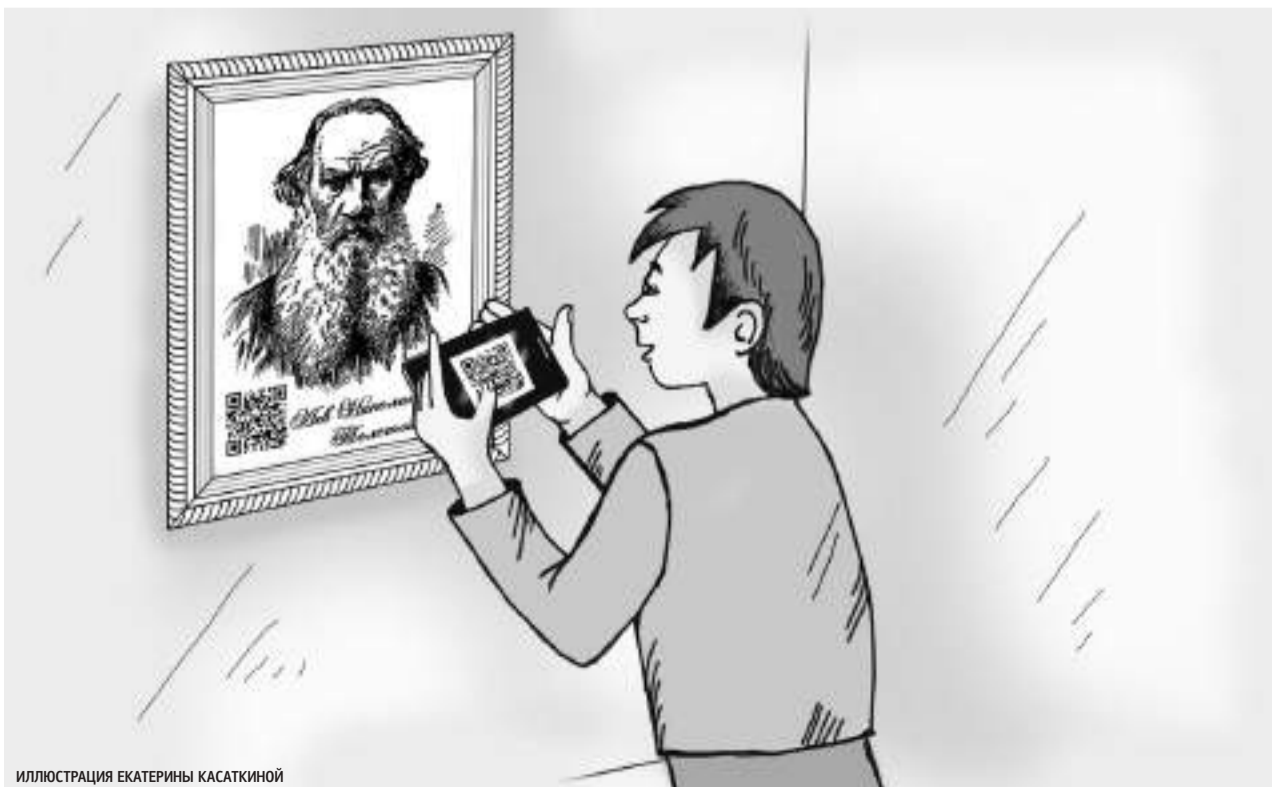
ИЛЛЮСТРАЦИЯ ЕКАТЕРИНЫ КАСАТКИНОЙ

QR-код легко определяется сенсором или камерой. И создать его может любой желающий, причём абсолютно бесплатно — для этого достаточно лишь выбрать подходящий генератор QR-кода. Обладать навыками программирования для этого не нужно, достаточно лишь ввести информацию, а остальное программа сделает сама. Для создания кодов существуют сайты-генераторы. Например, русскоязычный онлайн-сервис http://www.qrcoder.ru позволяет в несколько кликов закодировать любой текст, ссылку на сайт, визитную карточку. А для считывания необходима простая программа, которая устанавливается на телефон или планшет.