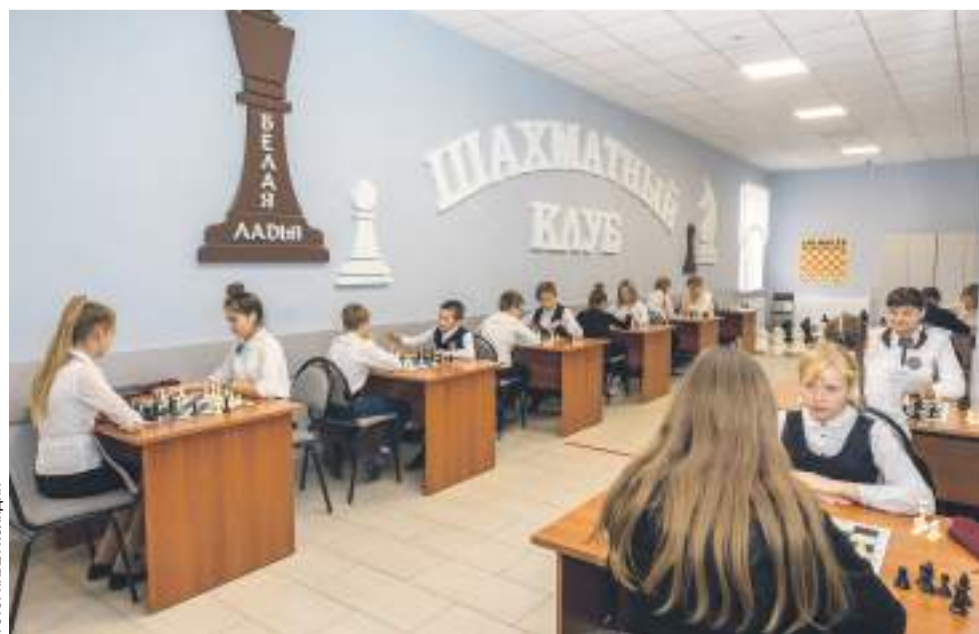
Шахматный клуб в Новооскольской школе с УИОП