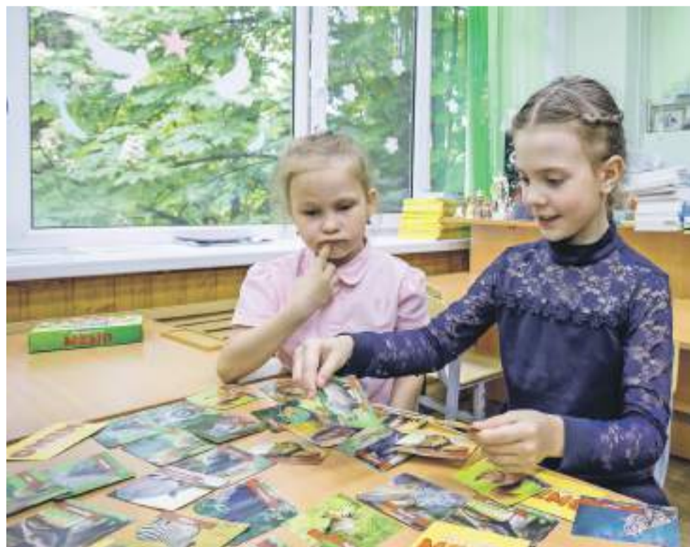
Одна из самых любимых настольных игр учеников 1 «Б» класса — «МЕМО»

Ольга МУШТАЕВА » ТЕКСТ