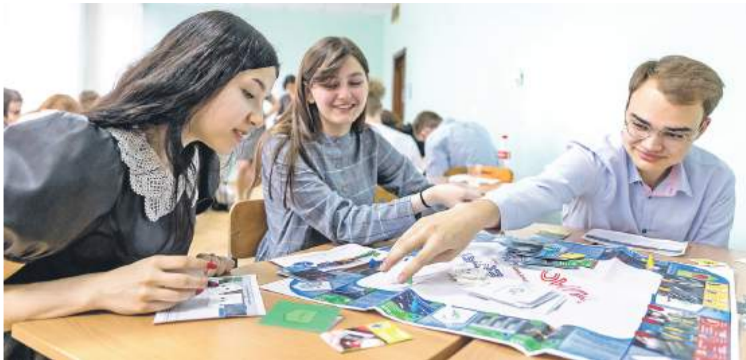
Ребята из 10 «В» играют в экономическую игру «Нановенчур»

КАК ИНТЕЛЛЕКТУАЛЬНЫЕ ИГРЫ МОТИВИРУЮТ ШКОЛЬНИКОВ УЧАСТВОВАТЬ В ОЛИМПИАДАХ И КОНКУРСАХ