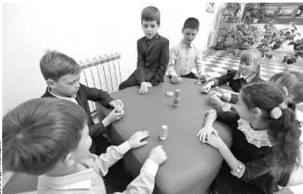
Игровая зона в Верхопенской школе Ивнянского района