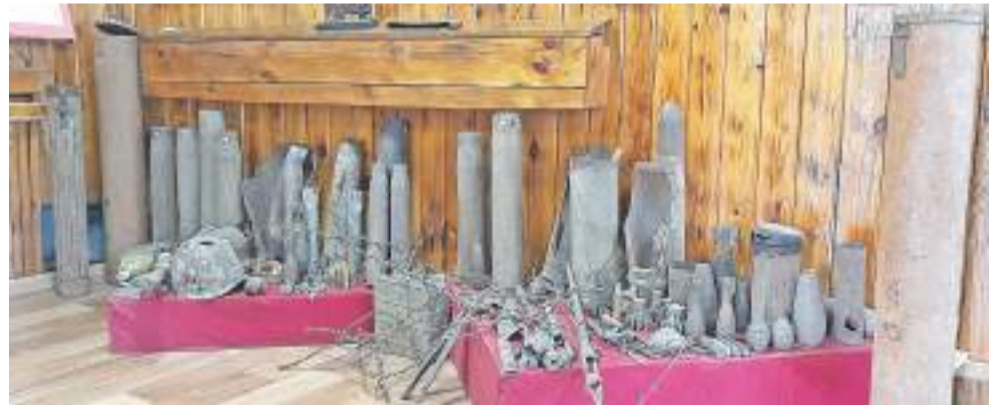
Эти экспонаты школьного музея ребята нашли во время походов и экспедиций