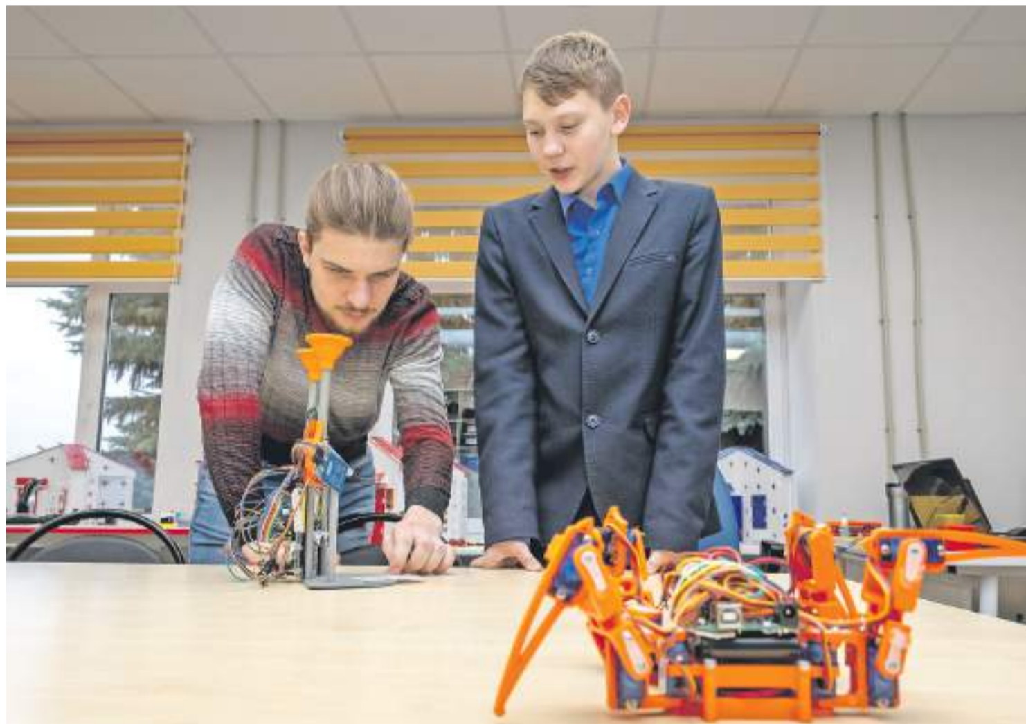
На занятии в детском технопарке, что разместился в Погореловской школе Корочанского района

Нацпроект «Образование» вызвал к жизни поиск наиболее интересных региональных практик, к которым с полным правом может быть причислена белгородская школа полного дня. Теоретические основы этого социально-педагогического явления были проработаны на проектных стратегических сессиях и концептуально представлены белгородскому сообществу в июле 2019 года, а уже с сентября 48 школ из 550 стали работать в таком режиме. В текущем учебном году таких школ 397, что свидетельствует об их востребованности.