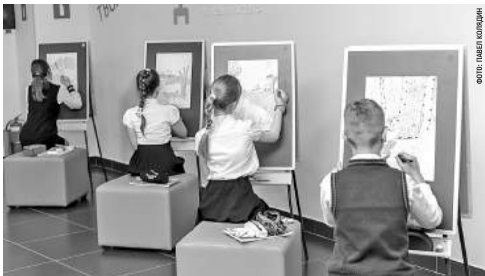
На внеурочных занятиях в Разуменской школе №4 «Вектор Успеха»