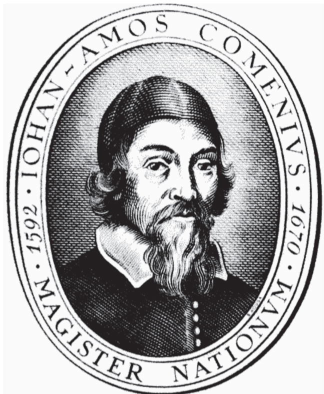
Коменский. Гравюра Джорджа Гловера

ПОЧЕМУ СЛОВА ВЕЛИКОГО ЧЕШСКОГО ПЕДАГОГА АКТУАЛЬНЫ И СПУСТЯ НЕСКОЛЬКО СТОЛЕТИЙ