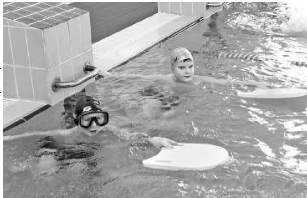
Внеурочка в Краснояружской школе № 2

Широко развитие в ШПД получили площадки для консультирования прежде всего по предметам, по которым есть письменные домашние задания, а также по наиболее трудным темам по любому предмету.