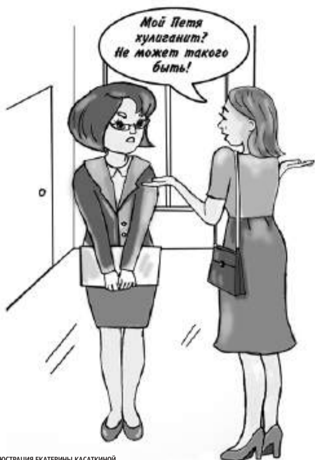
ИЛЛЮСТРАЦИЯ ЕКАТЕРИНЫ КАСАТКИНОЙ