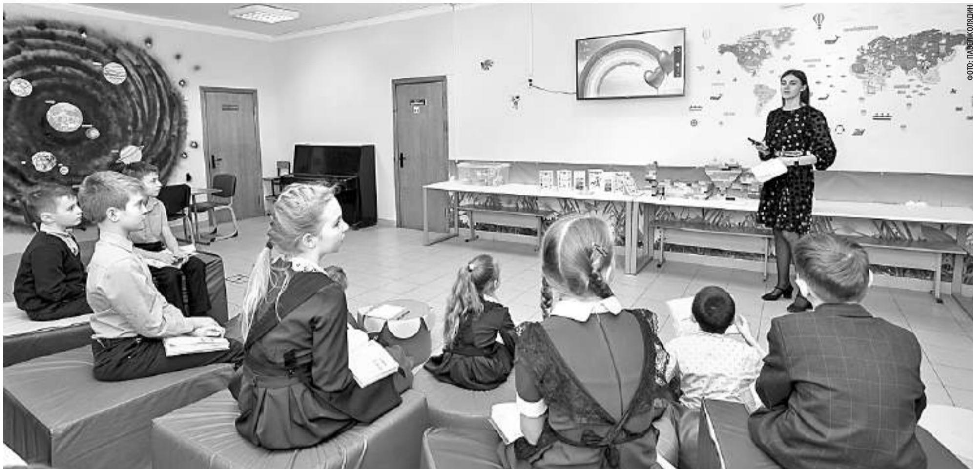
Литературный уголок в рекреационной зоне Борисовской школы №1 им А.М. Рудого